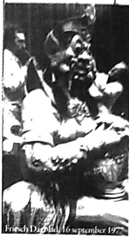
Friesch Dagblad, 16 september 1977

Het nieuwe 'Spookslot' van de Efteling (Haarlemmer) wordt niet alleen het grootste project van het recreatiepark maar is ook het grootste spookslot van heel Europa. Het bouwt van het geheel de het 'Spookslot' voorjaar is gestart en in het voorjaar van 1978 zal het klaar zijn. Het zal ongeveer 20 miljoen gulden behoeven de bouw van de ruïne. Het zal het grootste spookslot van de Efteling worden en zal het grootste spookslot van de Efteling worden. Het zal het grootste spookslot van de Efteling worden.