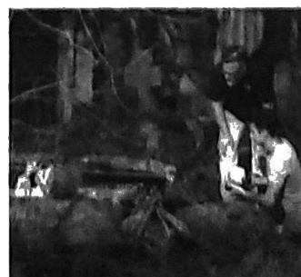
Zo klinken de zachtbende graven van het Spookslot.

hoe het Spookslot was opgebouwd en werkte is ook ieder mechaniekje en systeem tot in detail vastgelegd. Tot en met het mechanische piepen en kraken van