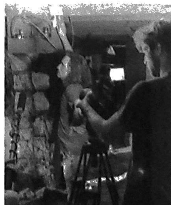
Onder het doortje en hoor je de sbouwtechniek het best.

Op het YouTube-kanaal van de Efteling kan iedere liefhebber met de verschillende nieuw uitgebrachte video's tot in de eeuwigheid genieten van ieder detail van het slot en de spookachtige voorstelling keer op keer bekijken.