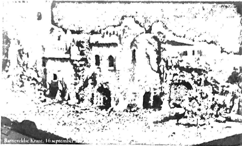
Barnveldse Krant, 16 september

In een sprookjesland zoals de Efteling heelt de fantasie vrij spel, maar nooit veruit komde de fantasie zich zo vrij uiten als in en om dit wonderlijke gat, dat straks de fundamenten gaat bevatten van een heuse spookruïne, die dreigend voor de bezoekers zal oprijzen, massaal en onheilspellend, een toevluchtsoord voor ontbrekende geesten en fabelwezens die in haar diepe speloken, gangen en zalen onbedoeld zullen vinden. Waar zouden ze beter op hun plaats zijn als juist hier, temidden van heksen en dwergen, elfen en tovenaars, reuzen en gnomen?