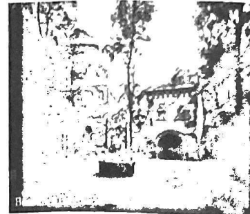
• Zal het Spookslot van de Efteling zijn krakende deuren sluiten?