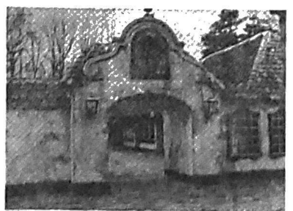
Een 'zuchtje' in het verkoopstijf 'In den Ouden Marktkramer' Op dit plekje is ook een openbare toiletvoorziening.

In steen en betonmassa van de spookruïne geeft een beeld van de enorme omvang van de ruïne en de eerste attractie van de Efteling, welke volgens andere in gebruik moet worden genomen.