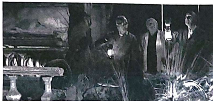
"44 jaar geleden hebben we dit gemaakt. Daar mogen we toch wel trots op zijn."

Bekijk deze en alle andere Spookslot-video's op youtube.com/efsteling