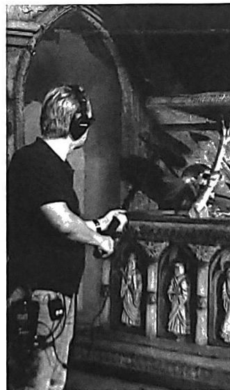
De audio van ieder mechaniekje is tot in detail vastgelegd.

Maar daar bleef het niet bij. Om over honderden jaren nog precies te weten