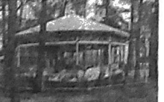
De aanbesteding van de Efteling is overigens niet een 100% voor de bouwactiviteiten van de Efteling.

Nieuw dit jaar zijn ook de 20 roeiboten en het 'verkoopstijf' tegenover het zelfbedieningsrestaurant het Witte Paard. Door de Efteling zijn kosten noch moeite gespaard om dit rustieke en nostalgische bouwwerk, dat in eigen beheer is uitgevoerd, te laten passen in het geheel en het een grappig element te laten zijn binnen het