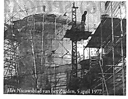
Het Nieuwblad van het Zuiden, 5 april 1977

In steen en betonmassa van de spookruïne geeft een beeld van de enorme omvang van de ruïne en de eerste attractie van de Efteling, welke volgens andere in gebruik moet worden genomen.